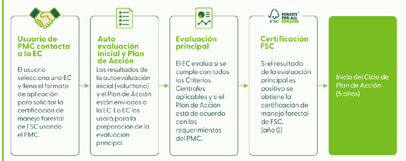
Diagrama de flujo de la parte inicial del proceso de mejora continua