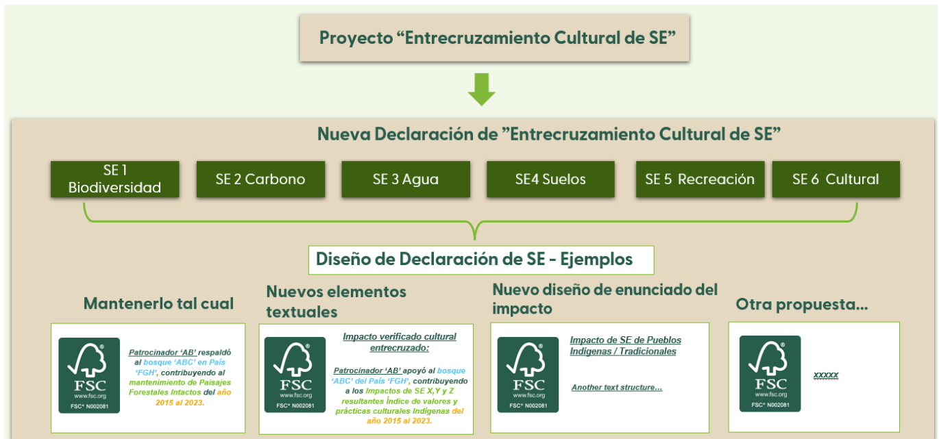
Figura 3 – Nuevas maneras posibles de diseñar la Declaración de SE de Entrecruzamiento Cultural”