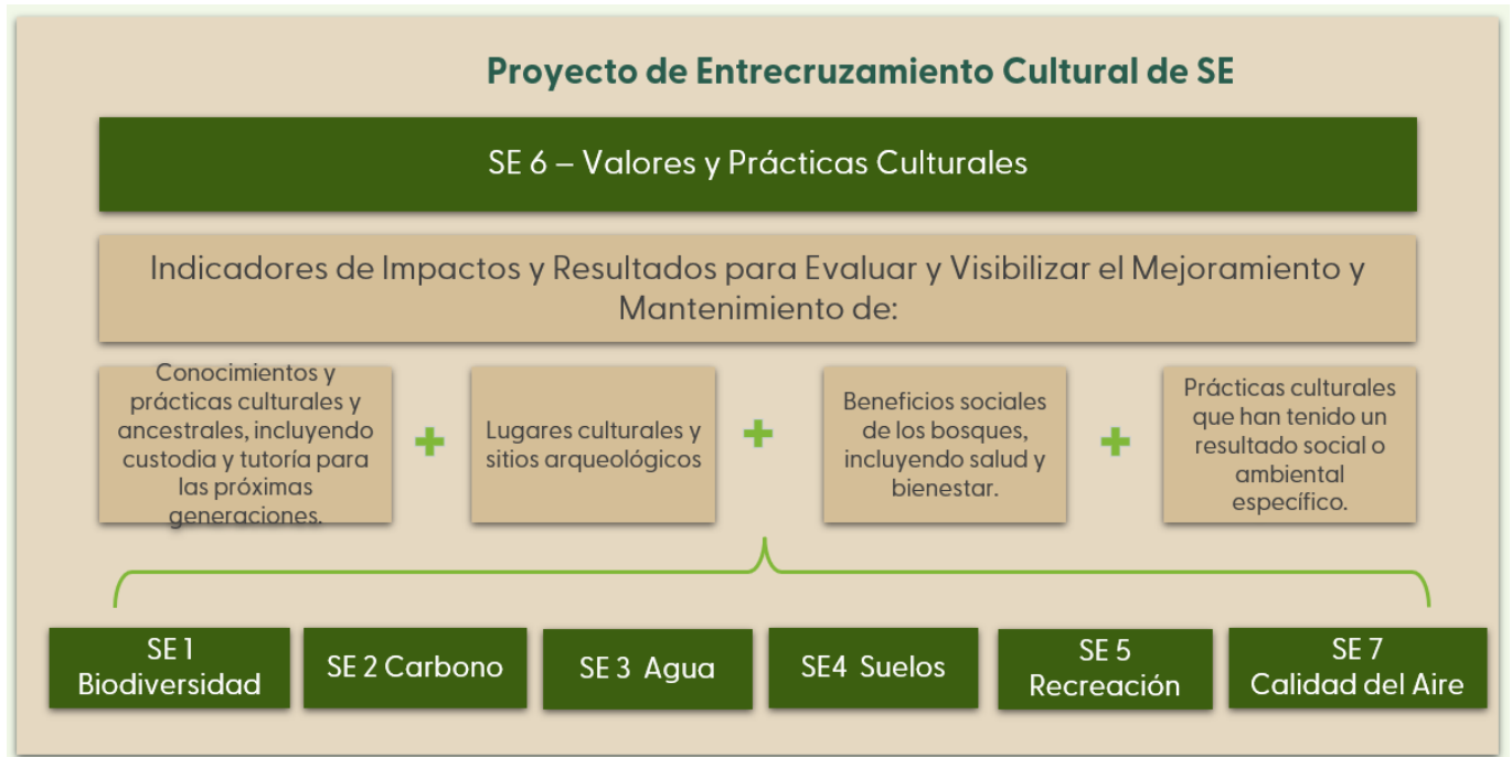
Figura 2 – La propuesta del proyecto “Entrecruzamiento cultural de SE”